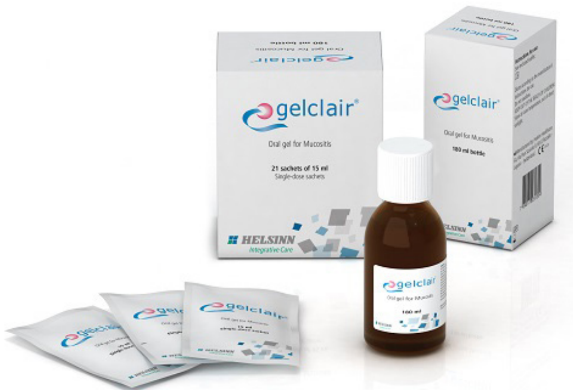
Láhev obsahující 180 ml přípravku

15 ml sáček přípravku (v 1 balení = 21 sáčků)